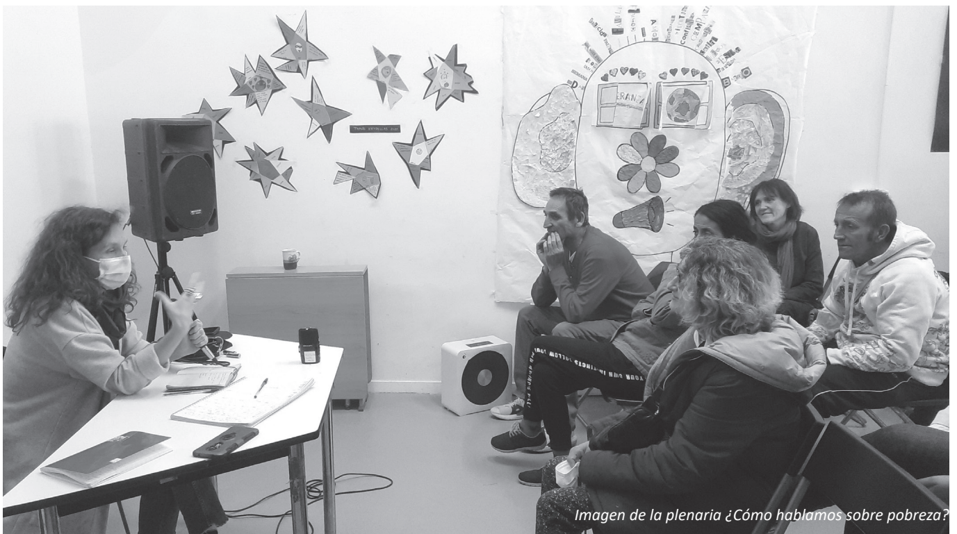
Imagen de la plenaria ¿Cómo hablamos sobre pobreza?

Estos 4 puntos son indisolubles. No incluir más que uno o dos la harían perder su razón de ser.