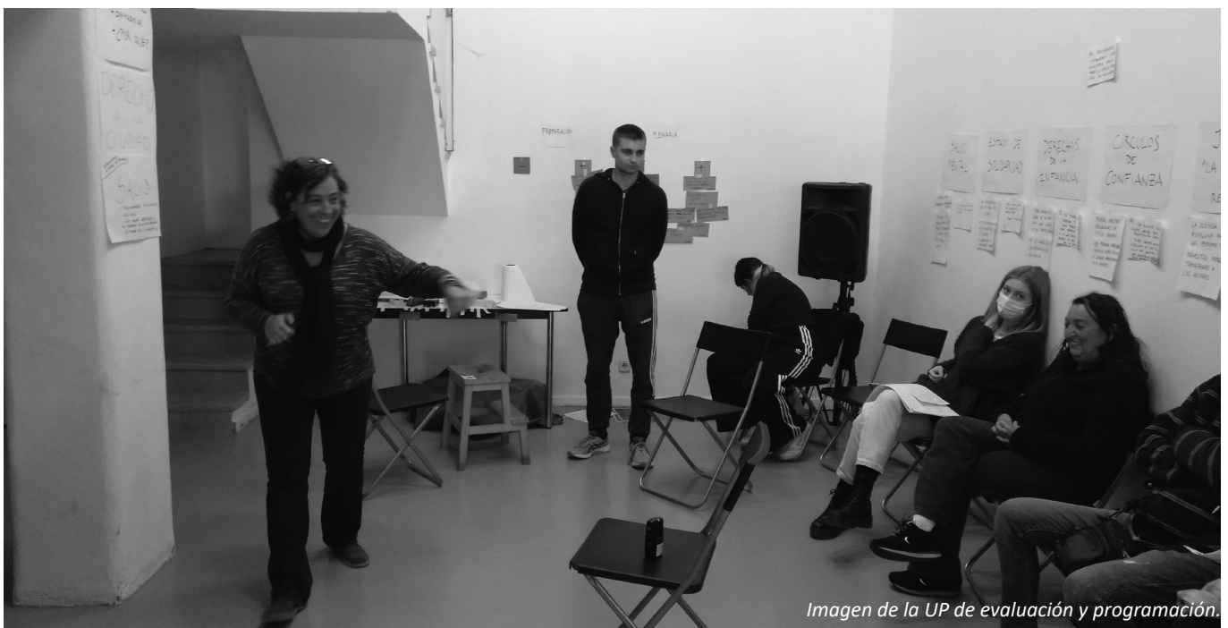
Imagen de la UP de evaluación y programación.

¡Muchas gracias a todas las personas que participaron en esta UP de trabajo y reflexión en común!